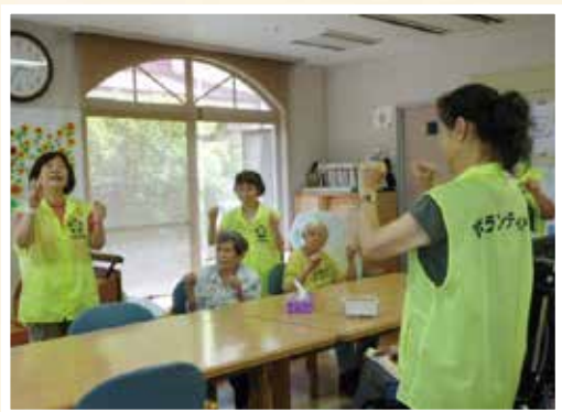
ボランティアの皆様と